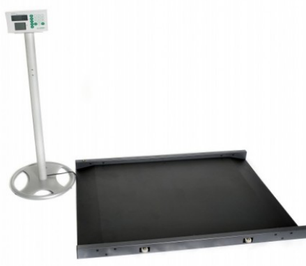
Model M-651 met statief