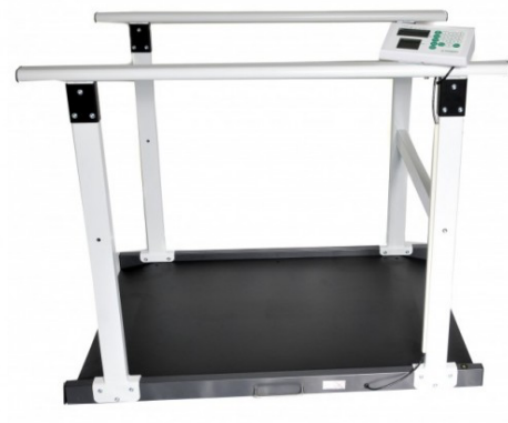
Model M-652 met handreling